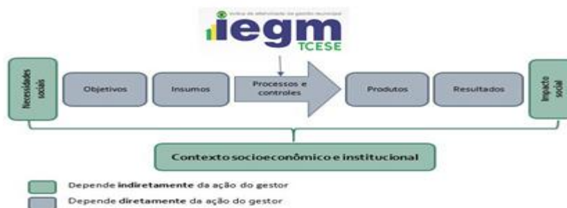
Figura 1: Modelo Lógico

Contudo, é importante ressaltar que as ações da gestão municipal não se traduzem automaticamente em resultados. Para entender sua contribuição é preciso considerá-las em um contexto mais amplo que envolve ainda a quantidade de recursos empregados (financeiros, físicos e humanos) e o contexto socioeconômico e institucional no qual o gestor está inserido, conforme detalhado no modelo lógico apresentado abaixo: